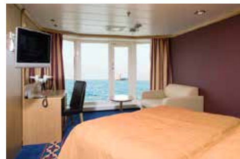
ガブリエラ号、デラックス

ヘルシンキ～ストックホルム ガブリエラ号/マリエラ号では最高のグルメ、お買い得な免税ショッピング、様々なエンターテイメントをお楽しみいただけます。ストックホルムおよびヘルシンキより毎日出航していますので、このクルーズは理想のバカンスとなるでしょう。