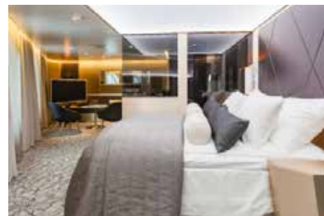
バイキング・グレース号、スイート

アモレラ号は子供から大人まで全ての年代の方々にお楽しみいただけます。ストックホルムからは夜出航の便、トゥルクからは朝出航の便が就航しています。