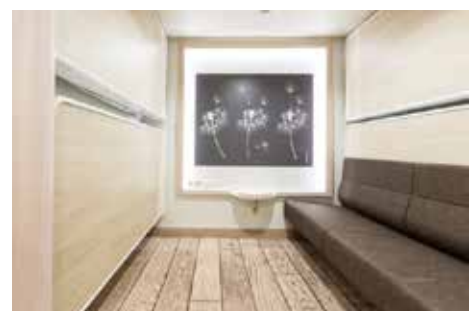
バイキング・グレース号、内側4人部屋