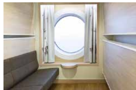
バイキング・グレース号、海側4人部屋