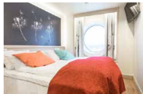
バイキング・グレース号、海側ダブル