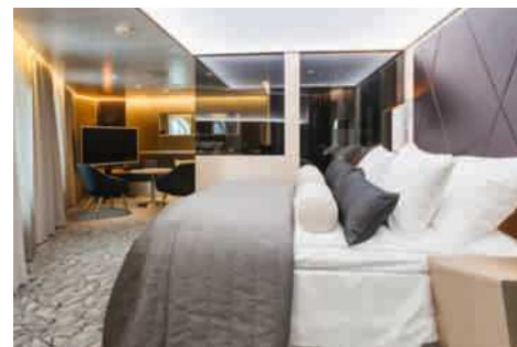
Viking Grace Suite

Pour les catégories de cabines, veuillez consulter notre site web : www.sales.vikingline.com .