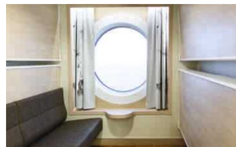
Viking Grace Vue sur mer, Cabine quadruple