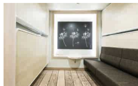
Viking Grace Intérieur, Cabine quadruple