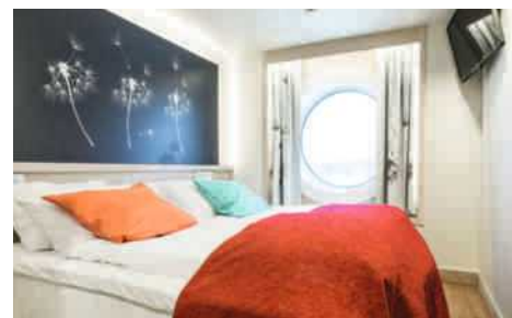
Viking Grace Vue sur mer, Cabine double