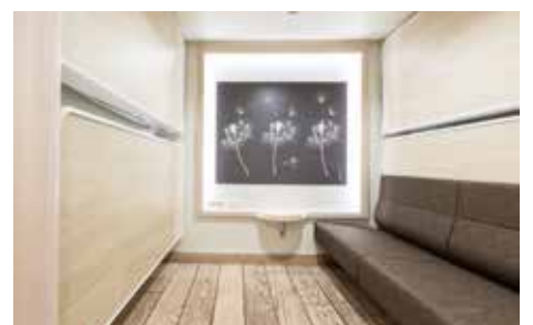
Viking Grace camarote interior para cuatro personas