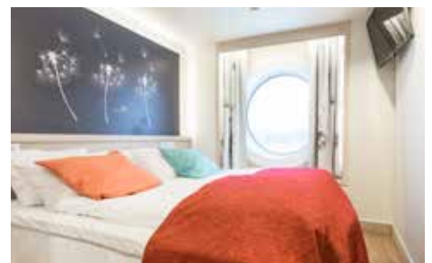
Viking Grace camarote doble con vistas al mar