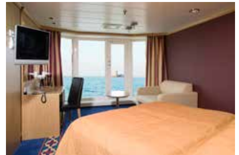
Gabriella camarote de lujo