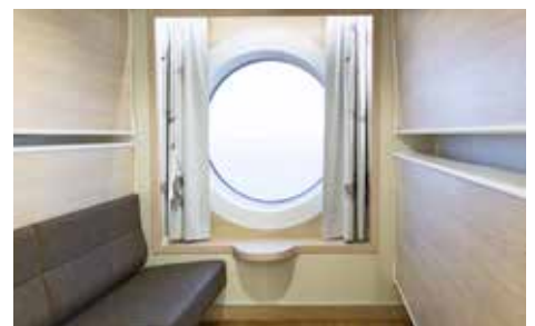
Viking Grace camarote para cuatro personas, con vistas al marposti