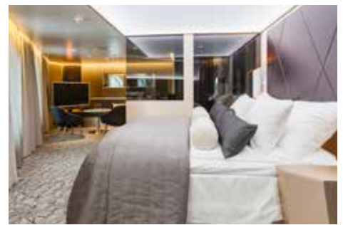
Viking Grace Suite

Para obtener información sobre las diferentes categorías de camarotes, consulte nuestra página web www.sales.vikingline.com .